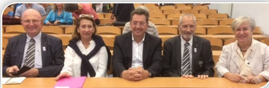
Les élus de Caluire, du CDOS et de l'UGSEL

Pour faire suite à l'invitation de l'Union Générale Sportive de l'Enseignement Libre (UGSEL), le Comité était présent à leur Assemblée Générale du 17 octobre 2018. Ce fut l'occasion de mieux connaître les actions mises en place pour développer les activités sportives dans un cadre scolaire et d'apprécier la place qui est donnée au badminton.