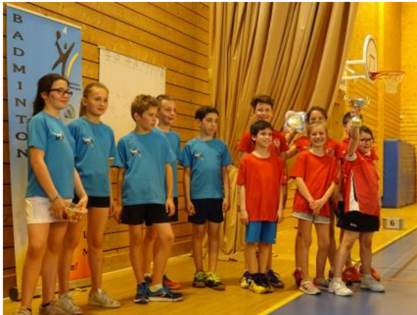
L'équipe Benjamins de Chassieu victorieuse contre l'équipe d'Oullins