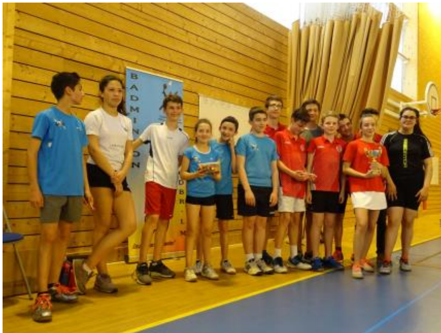
L'équipe Minimes de Chassieu victorieuse contre l'équipe d'Oullins