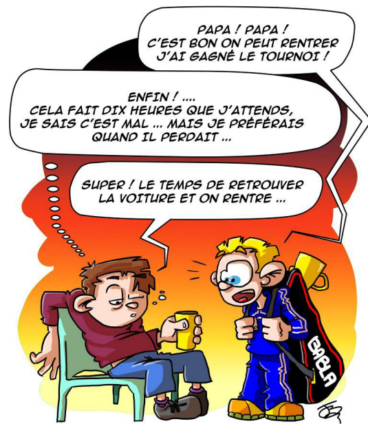
Illustration de Jérôme Bissay

Après ce regard sur cette jeune génération, ce fut l'occasion de saluer et remercier les parents qui s'investissent en accompagnant leurs enfants sur ces entraînements.