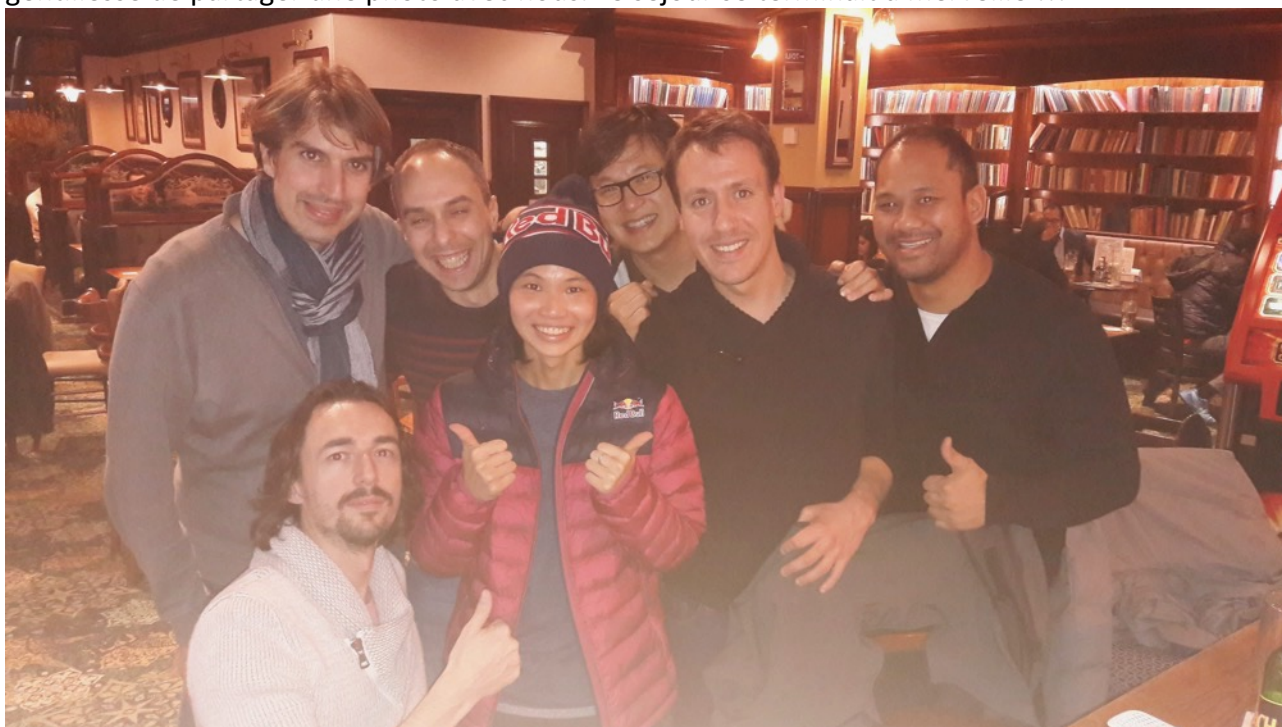
Tsai Tzu Ying (Taiwan - N°1 mondiale en Simple Dames) entourée de la délégation du BACLY

2 heures plus tard, ce que nous avons prévu se réalisa. Tsai Tzu Ying est entrée dans le pub accompagnée de son entraîneur dans un « tonnerre d'applaudissements » de 6 français joyeux comme des gamins qui rencontraient une de leurs idoles. D'abord un peu surprise, elle eut la gentillesse de partager une photo avec nous. Le séjour se terminait à merveille !!!