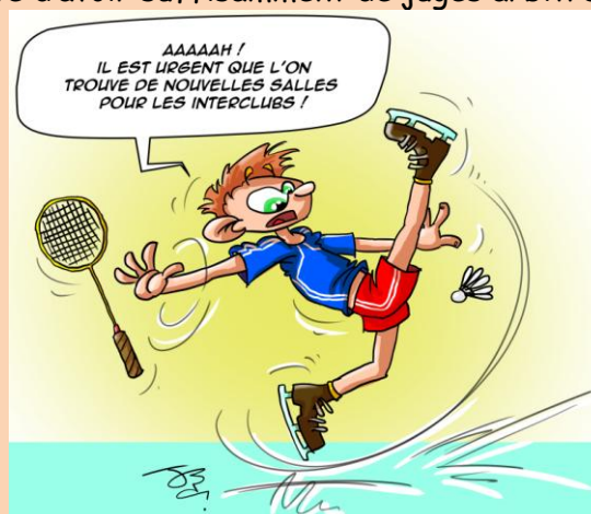
illustration de Jérôme Bissay

- Coupe du Rhône-Lyon Métropole : L'édition 2016 est annulée faute d'avoir suffisamment de juges arbitres.