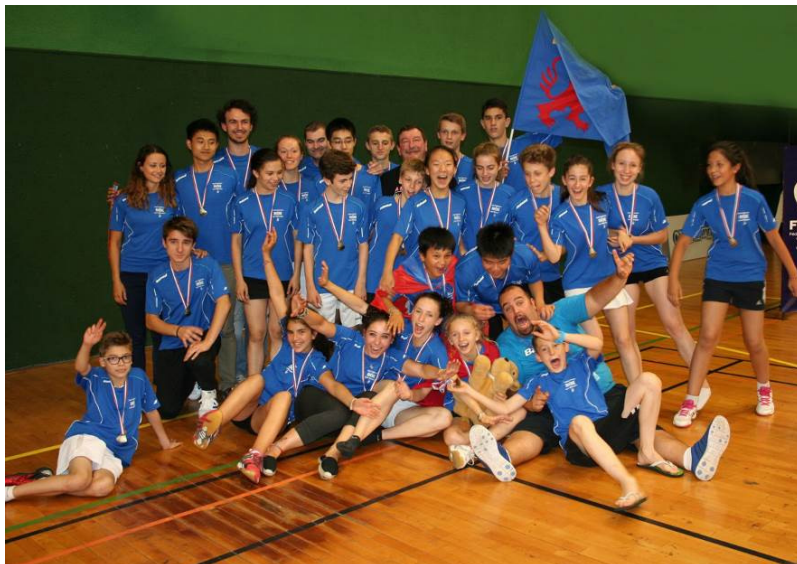
L'équipe du 69, 3 e en 2015

Tournoi Départemental Jeune de Chazay d'Azergues