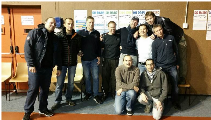
Ci-dessus les bénévoles du « CGB 69 » le vendredi 11 décembre 2015 à 23h30 lors de l'installation du gymnase.

Un total de 270 matchs sur l'ensemble de la compétition des séries R4/R5, R6/D7, D8, D9/P1 et P2/P3/NC.